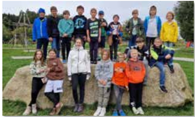
↑ Klasse MS 05