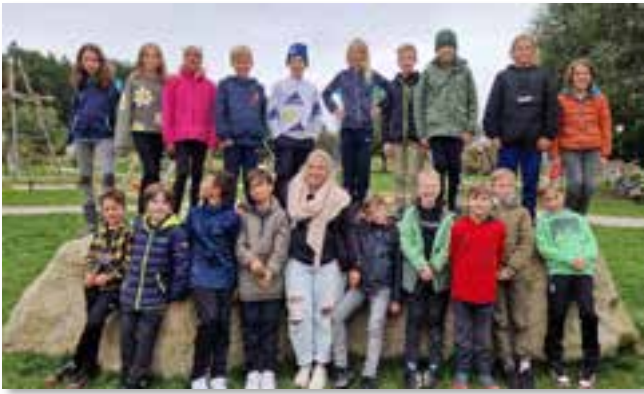
↑ Klasse RS 05

Noch schnell ein Gruppenfoto – und ab zurück zur Unterkunft.